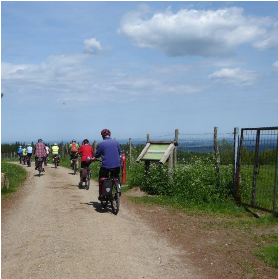
Radtour von Simmerath bis Zweifall 18.05.2022

„Sportliche Nordic-Walking Tour“ der Ortsgruppe Simmerath im Eifelverein. Nicht für Anfänger geeignet.