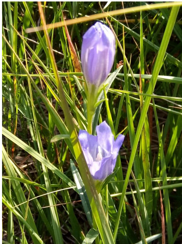
Lungenezian im Hohen Venn

PKW-Anfahrt 55 km. Entlang der Erft reihen sich von Sindorf an Orte reich an Mühlen, Schlössern und Museen. Das Schloss Pfaffendorf gilt als das Schönste aller Erfttalschlösser. Dort untergebracht ist das Informationzentrum von RWE Power. Sowohl das Schloss wie die Städte Bergheim und Bedburg werden angefahren, zuletzt auch der Tagebau Hambacher Forst mit Blicken in eine andere Welt.