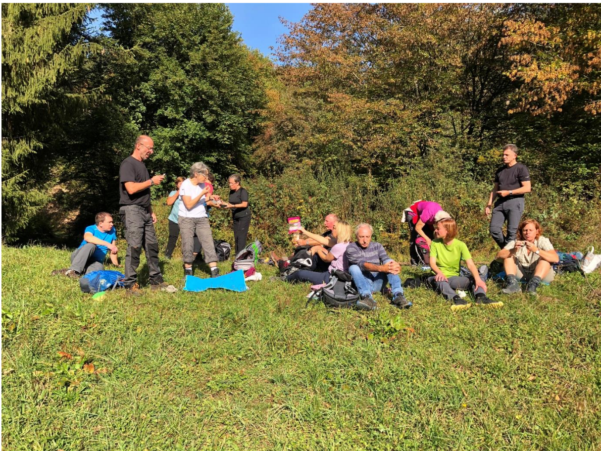
Picknick bei der 13. Etappe des Eifelsteigs 06.10.2018